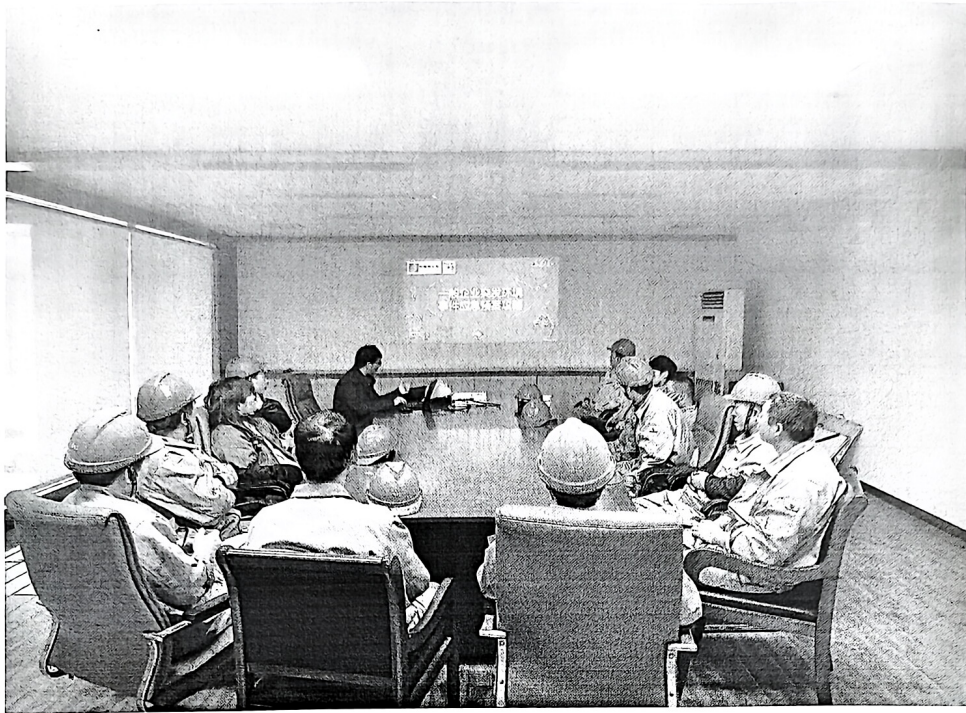
中电电机 2024 年突发环境应急培训及演练现场照片